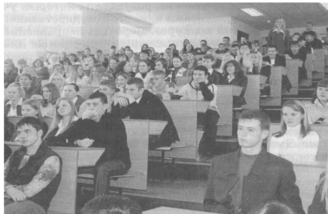
Рис. 1. Студенты в аудитории

Высшее образование можно получить в вузах, которые созданы в разных формах: университет, академия, институт. При этом в каждом высшем учебном заведении существует своя специфика подготовки профессионалов (рис. 1).