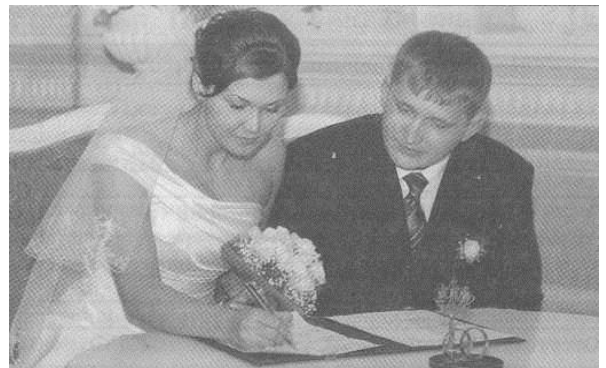
Рис. 1. Заключение брака

Для оформления брачных отношений жених и невеста подают в орган записи актов гражданского состояния (ЗАГС) специальное заявление. Оно заполняется по разработанному образцу и подписывается каждым самостоятельно. Законом предусматривается регистрация брака по общим правилам через месяц после подачи указанного заявления. Такой срок устанавливается для того, чтобы люди могли обдумать свое решение, подготовиться к предстоящему событию (рис. 1).