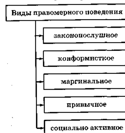
Схема 1. Виды правомерного поведения

Конформистское поведение характеризуется низкой степенью активности людей, которые стараются вести себя так,