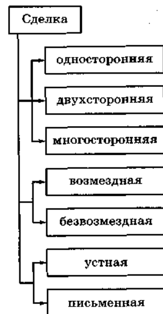
Схема 1. Виды сделок

Сделка, при совершении которой не соблюдены условия, считается недействительной , а соответственно, и действие, совершенное в форме сделки, не влечет правовых последствий. Недействительные сделки подразделяются на ничтожные и оспоримые. Ничтожной считается сделка, недействительность которой вытекает из самого факта ее совершения. Признание судом такой сделки