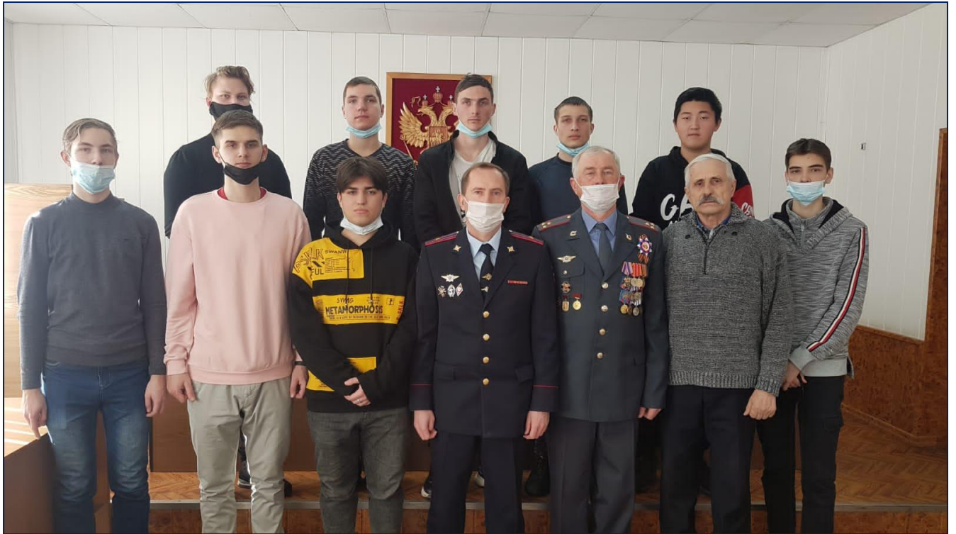
В актовом зале МО МВД РФ «Лесозаводский»