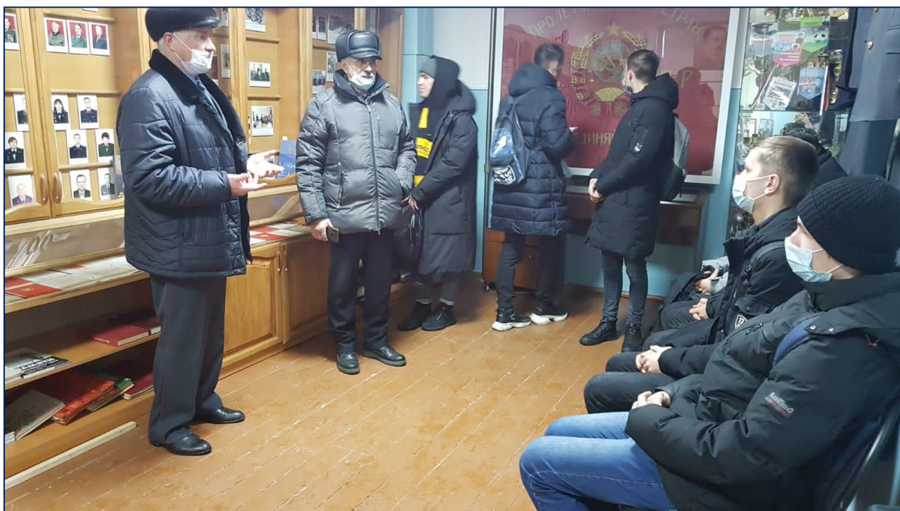
В музее МО МВД РФ «Лесозаводский»