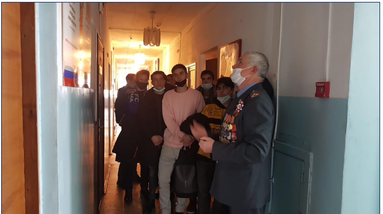
Рассказ о героях МО МВД РФ «Лесозаводский»