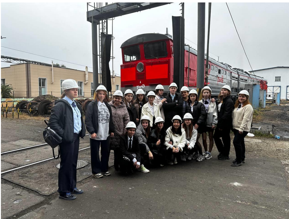
Рис.6 Экскурсия на Уссурийский локомотиворемонтный завод в рамках Недели без турникетов

Куратор выполняет роли наставника студентов, диагноста, старшего товарища. По отношению к группе, куратор выступает организатором, методическим руководителем, воспитателем, педагогом-психологом.