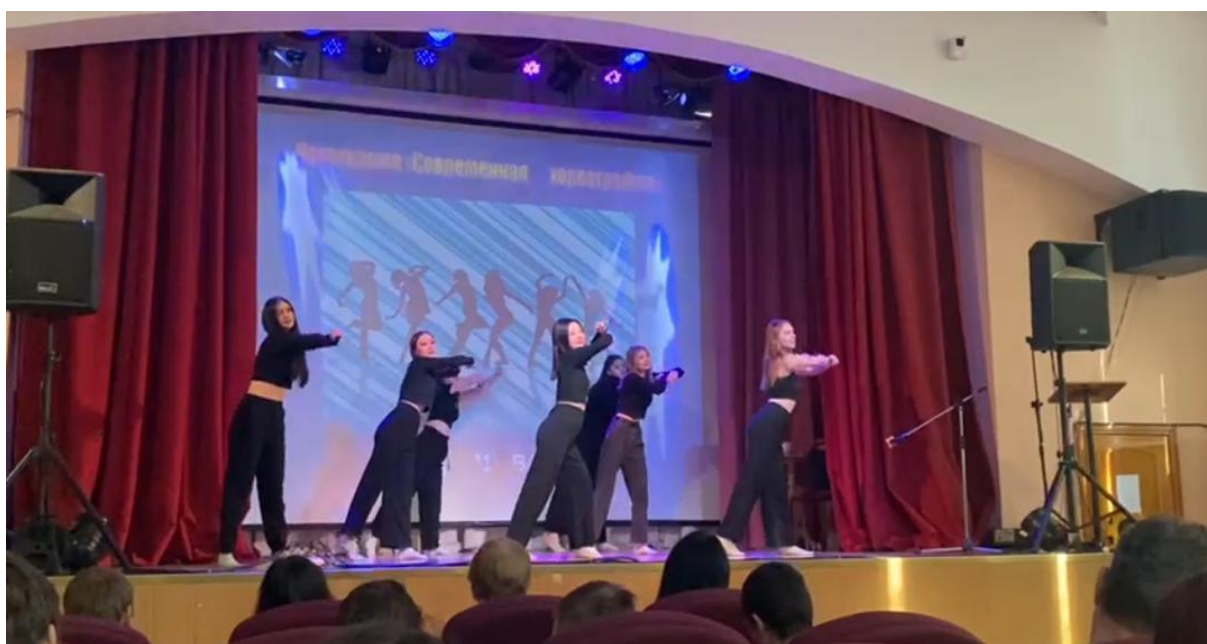
Рис.2. Открытый творческий конкурс «ПримИЖТ – территория талантов», танцуем

Творческая функция куратора направлена на подготовку и проведение группой внеучебных мероприятий. Залогом успешного выполнения этой функции является желание куратора быть вовлеченным изнутри в творческий аспект деятельности группы.