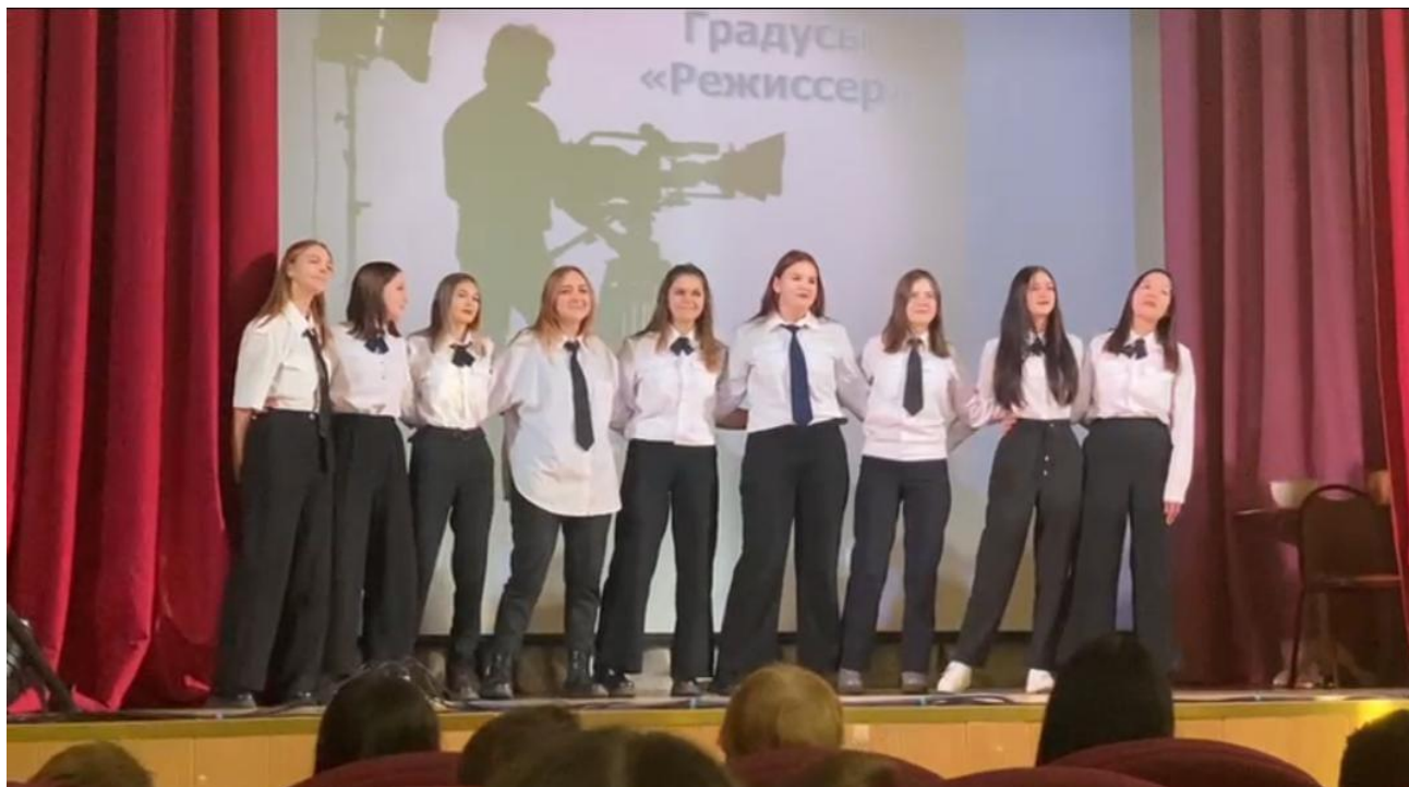
Рис.3. Вокальное исполнение – 1 место

Используя индивидуальный подход к каждому студенту группы, кураторы техникума в процессе воспитательной работы обращают внимание на такие параметры, как: