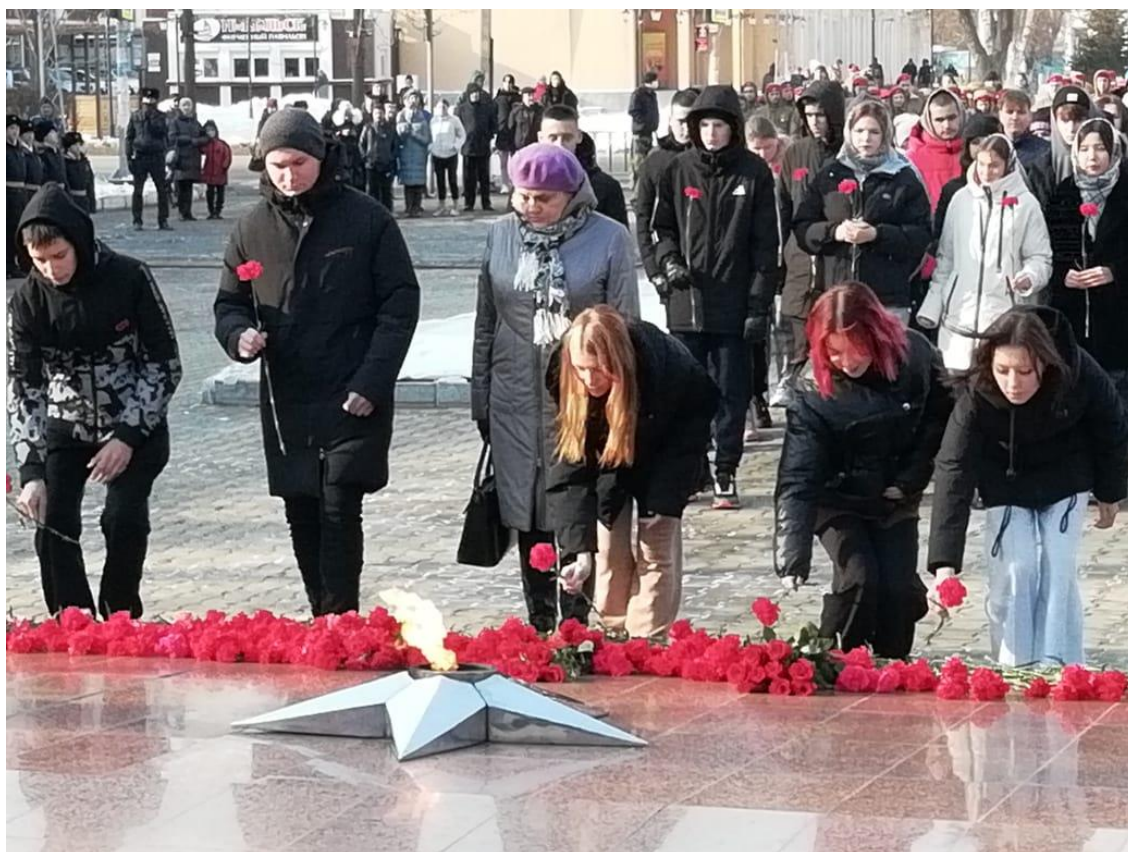
Рис. 7 Церемония возложения венков и цветов к Мемориальному комплексу воинам- уссурйцам, погибшим в годы Великой Отечественной войны 1941-1945 гг., посвященная Дню Неизвестного солдата.

совершенно незнакомых людей. Здесь встали на повестку дня и вопросы питания, личной гигиены, отдыха и подготовки к занятиям. Помочь такой адаптации - важная задача куратора. В поле зрения его работы должны входить все вопросы, связанные с жизнью студента-первокурсника.