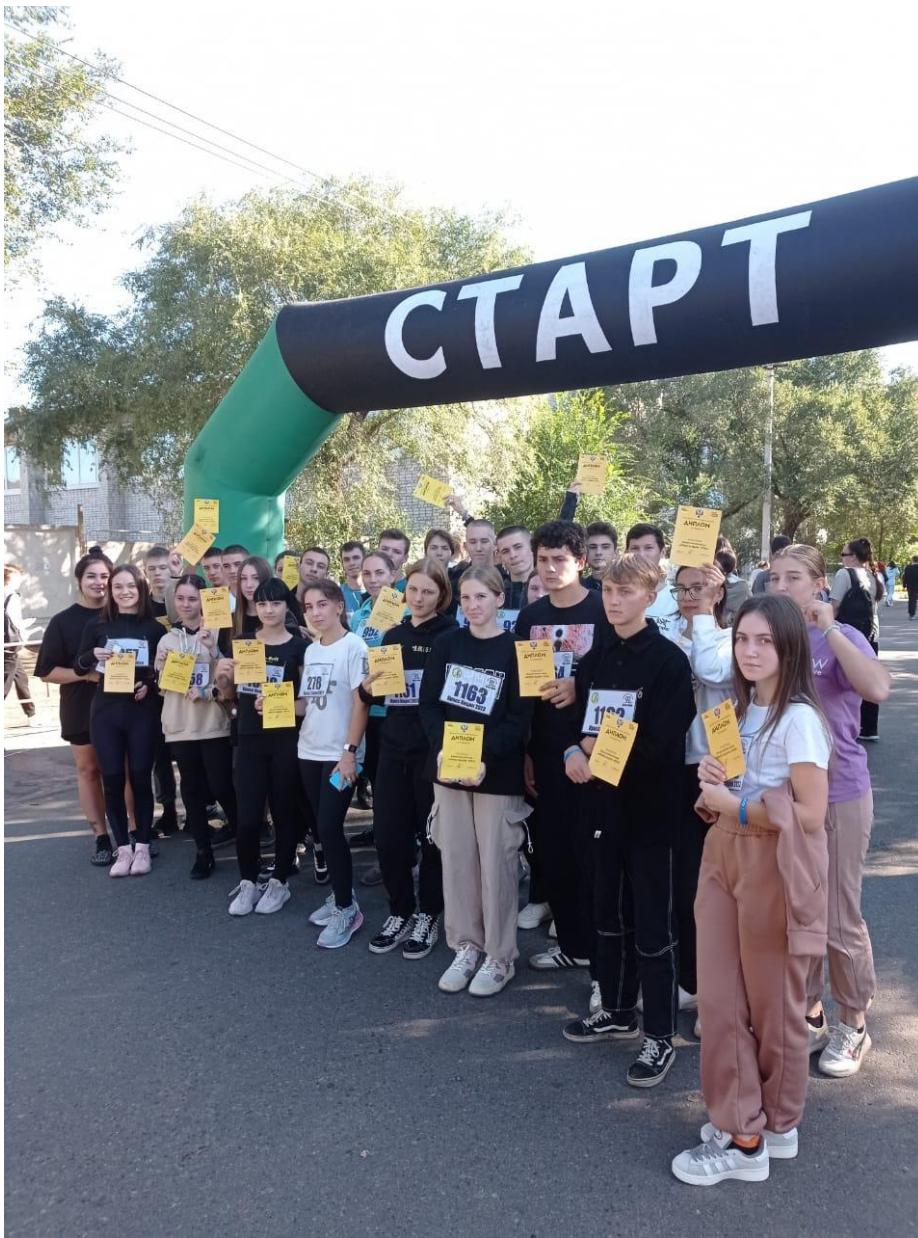
Рис.4. Всероссийская акция «Кросс нации-2023»

Успех деятельности зависит от профессионального мастерства педагога. Куратором составляется воспитательный план. План - это средство повышения качества воспитательной работы куратора.