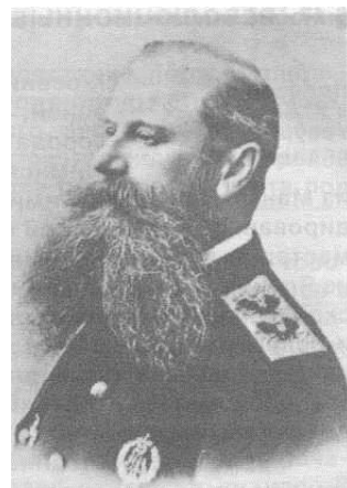
Степан Осипович Макаров

В конце апреля – начале мая 1904 г. начались активные боевые действия на суше. Японская армия, превосходившая русскую по численности, подготовке, имевшая возможность использовать резервы, наносила русским войскам поражение за поражением. Героизм солдат, строевых офицеров и отдельных частей не мог изменить ход войны.