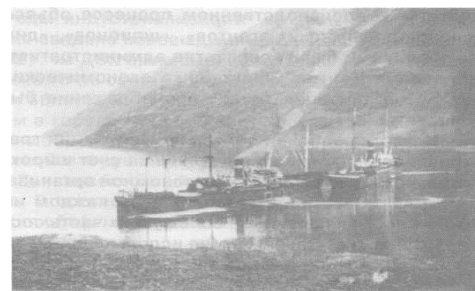
Китобазы «Алеут» в 30-е годы

Авиарейсы связали Владивосток с Москвой и северными районами Дальнего Востока.