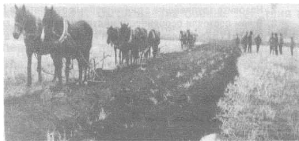
Обработка земли в селе Монастырище. 30-е годы

К концу второй пятилетки коллективизация в Приморье завершилась. В колхозы было объединено 93% крестьянских хозяйств и 99,5% посевных площадей. Однако репрессии против крестьян не прекратились. Осенью 1937 г. в районы Казахстана и Средней Азии было выслано 180 тыс. корейцев, в основном земледельцев; около 2,5 тыс. чел. из них – арестовано. Всего за 1937-1939 гг. была насильственно выселена примерно пятая часть жителей края.