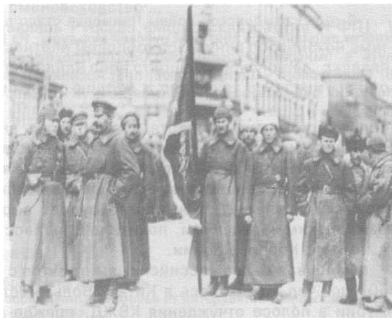
Октябрь 1922 г. – Народно-освободительная армия вступила во Владивосток

Со взятием Владивостока на Дальнем Востоке закончились гражданская война и интервенция. В боях с той и другой стороны, а также от ран, голода, лишений погибло около 80 тыс. чел. За границу эмигрировали сотни тысяч россиян.