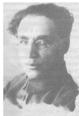
Александр Михайлович Краснощеков – председатель Краевого комитета Советов (Дальсовнаркома)

Непросто сложились отношения новых органов власти и казачества. Правление Уссурийского казачьего войска стремилось к автономии, фактически к независимости от власти Советов. В январе 1918 г. IV Войсковой круг избрал атаманом И.П.Калмыкова – представителя зажиточного казачества. Калмыков установил связь с представителями Японии, Англии и Франции и при их финансовой поддержке приступил к формированию отряда в полосе отчуждения КВЖД. В марте совещание