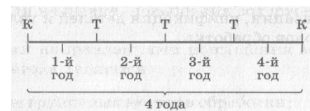
Рис. 4.4. Ремонтный цикл (К – капитальный ремонт; Т – текущий ремонт)

Основным нормативом системы ППР является ремонтный цикл – промежуток времени между двумя очередными капитальными ремонтами, который измеряют в годах. Количество и последовательность входящих в него ремонтов и осмотров составляют структуру ремонтного цикла (рис. 2). На рисунке видно, что ремонтный цикл между двумя капитальными ремонтами составляет 4 года, и в этот период выполняют три плановых текущих ремонта.