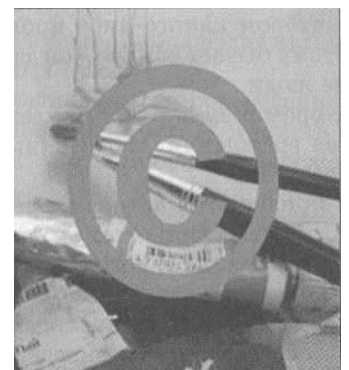
Рис. 1. Защита интеллектуальной собственности