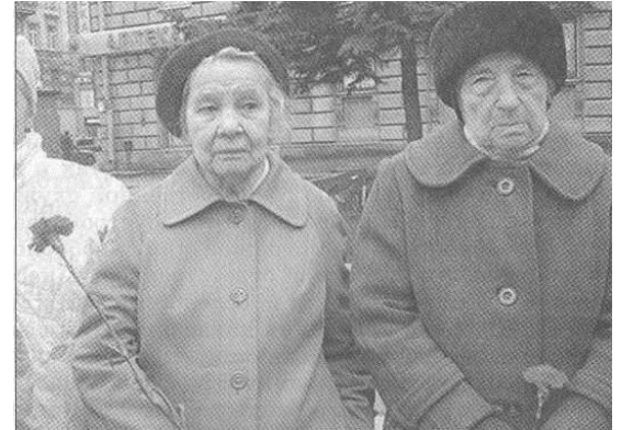
Рис. 1. Пенсионеры

Трудовая пенсия по старости назначается тем лицам, которые достигли определенного возраста и имеют трудовой стаж. Право на трудовую пенсию по старости имеют мужчины, достигшие возраста 65 лет, и женщины с 60 лет (рис. 1). Трудовая пенсия по старости назначается при наличии не менее пяти лет страхового стажа. Размер трудовой пенсии определяется на основании соответствующих данных, имеющихся в распоряжении органа, осуществляющего пенсионное обеспечение, по состоянию на день, в который этим органом выносится решение о назначении трудовой пенсии, и в соответствии с нормативными правовыми актами, действующими на этот день.