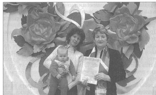
Рис. 2. Выдача государственного сертификата