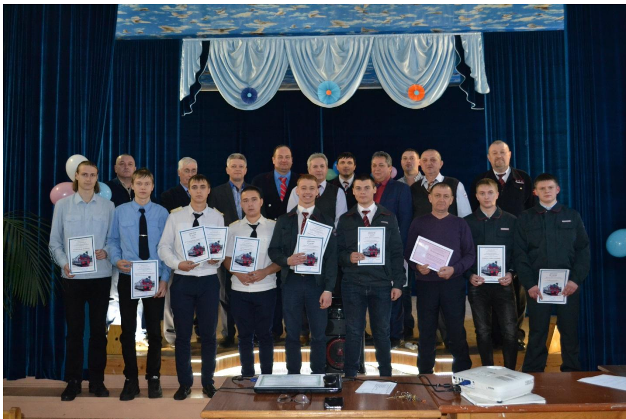
Общее фото конкурсантов, наставников и экспертов на память.

При подведении итогов конкурса социальные партнеры дали общую оценку подготовки студентов «хорошо» .